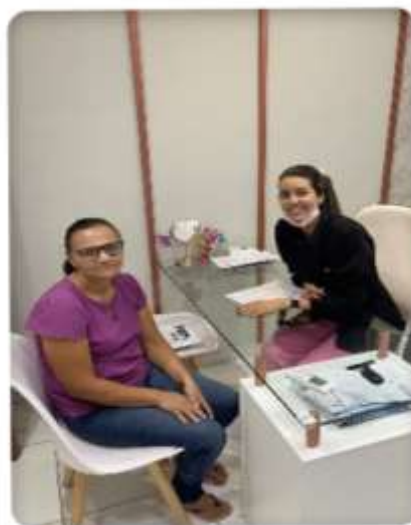
Exames de prevenção e exames laboratoriais